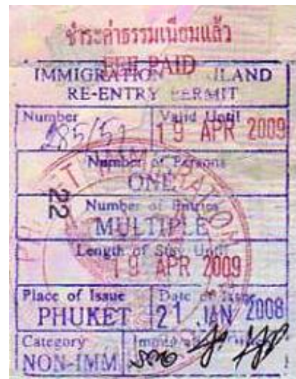
The example of Re-entry permit