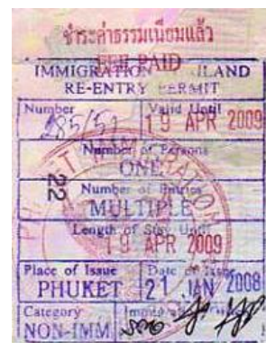
ตัวอย่าง Re-entry permit แบบ Multiple