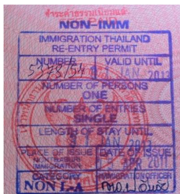
ตัวอย่าง Re-entry permit แบบ Single